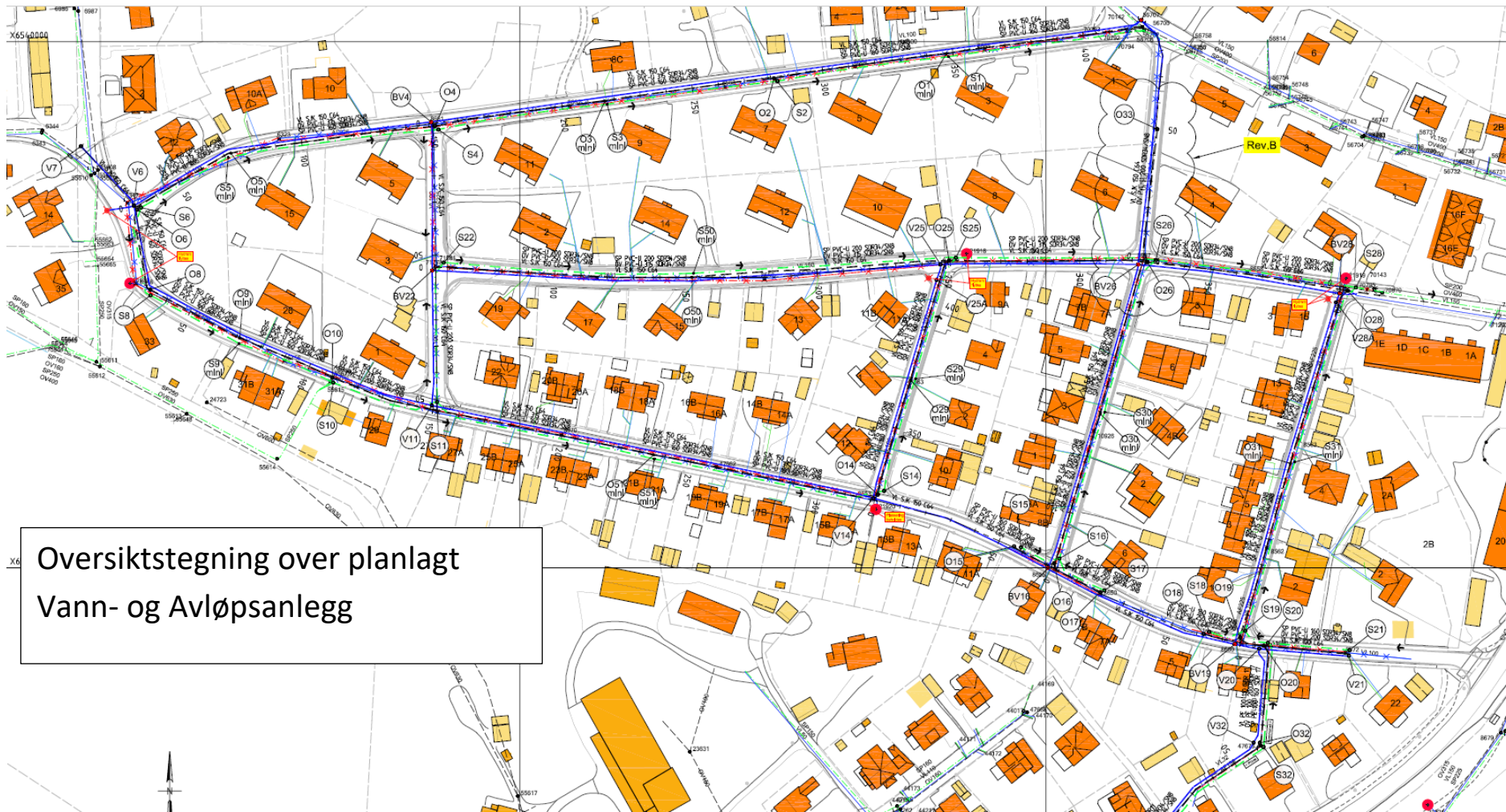
Figur 1 - Oversikt over gravetraseer.