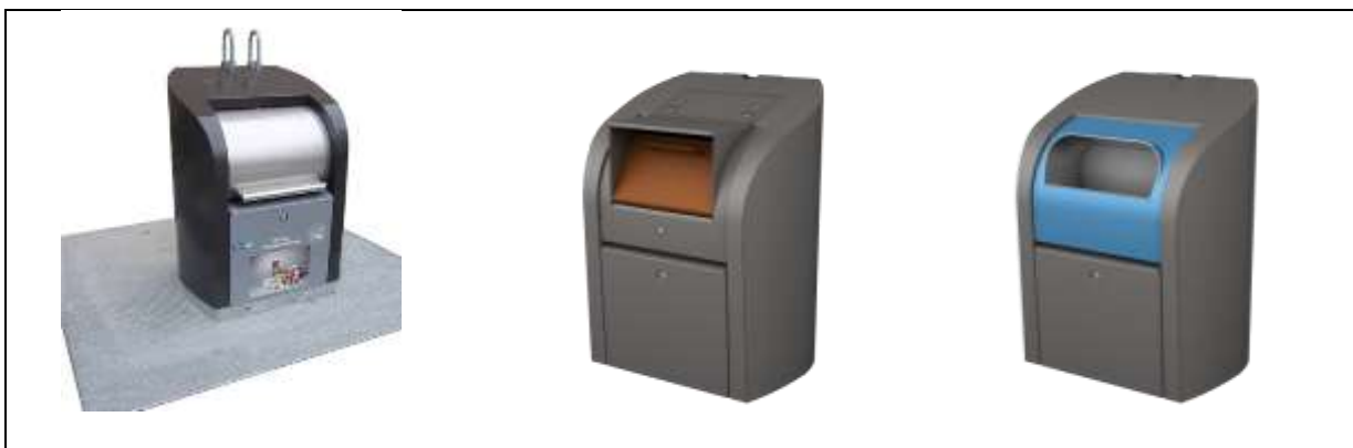
Helt nedgravd container - innkastsøyler med ulike innkasttyper – PWS Norge.