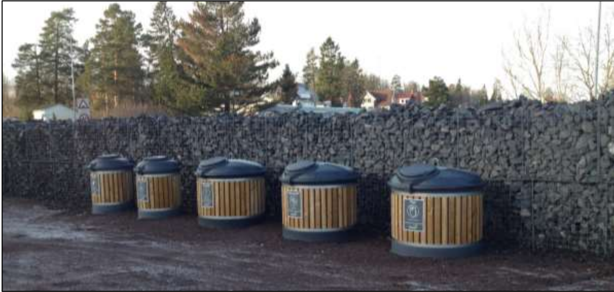
Delvis nedgravd container – Enviropac