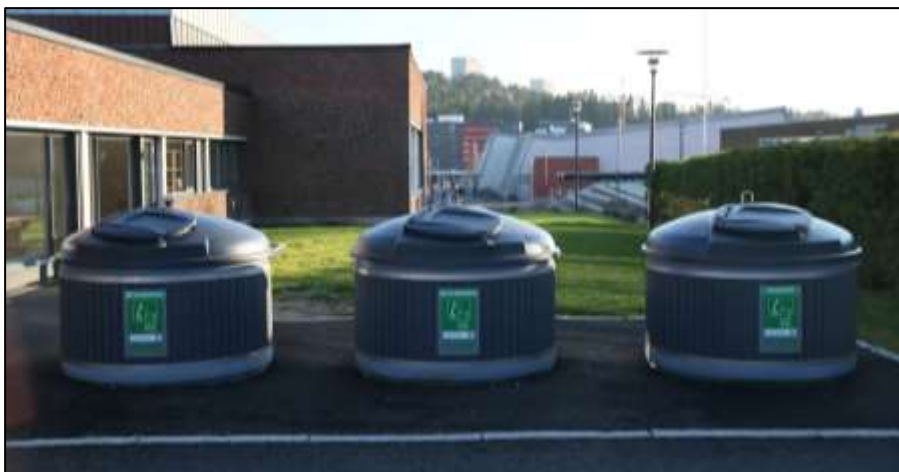
Delvis nedgravd container fra Strøbergers plast

Løsningen til Strøbergers Plast kan besiktiges på følgende steder i Vestfold: