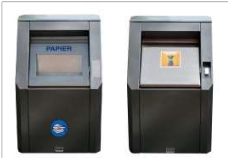
Helt nedgravd containerløsning Alle Miljø – typer innkastsøyer

Helt nedgravd container fra Alles Miljø kan besiktiges på følgende steder i Vestfold: