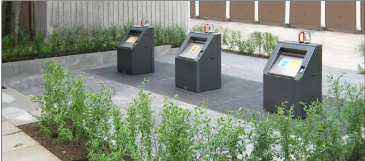
Helt nedgravd containerløsning Alle Miljø