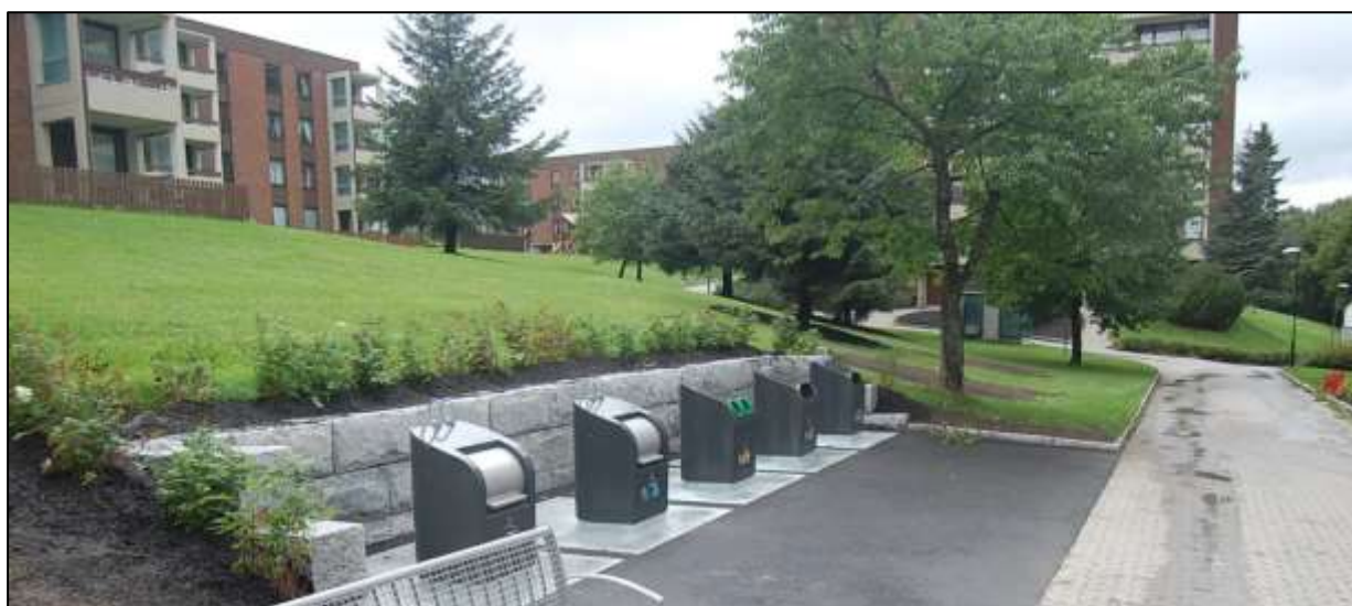
Helt nedgravd containerløsning PWS Norge

Helt nedgravd container fra PWS Norge kan besiktiges på følgende steder i Vestfold: