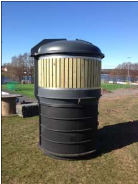
Delvis nedgravd container – Enviropac

Delvis nedgravd containerløsning fra Enviropac kan besiktiges på følgende steder i Vestfold